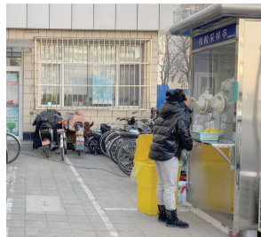
医护人员在亭内开展核酸检测