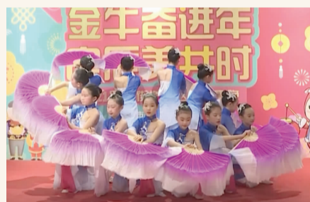
舞蹈《风酥雨忆》展现双井少年才艺