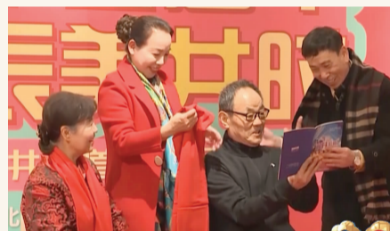
节目《拜大年》中,一家人共度平安祥和的春节。