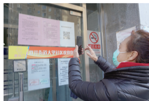
居民扫码预约疫苗接种