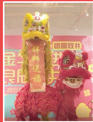
祥狮送福祝福双井的未来更美好