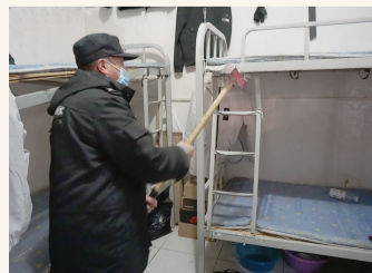
工作人员现场拆除群租房

本次检查中,工作人员还对辖区内居民私接电线给电动车充电、煤气使用等安全问题进行了检查,并提醒居民注意用电、用气的安全。后续工作人员还会加大对辖区内相关问题检查,欢迎居民提供线索。