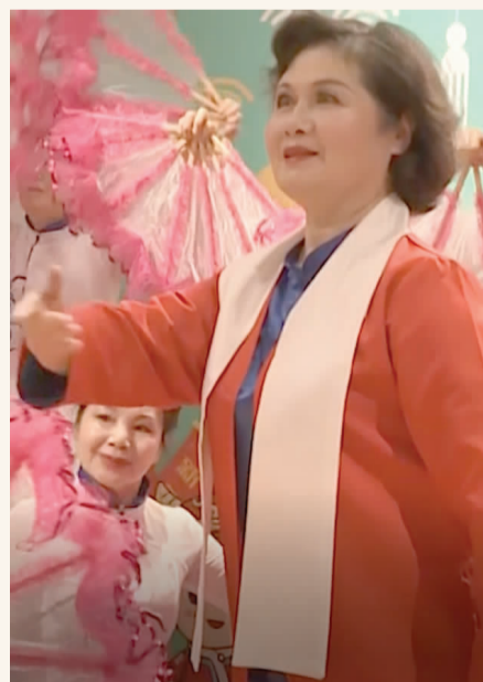
居民用表演致敬前辈,展现共产党人革命历史。