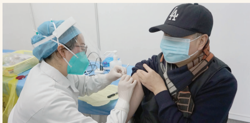
社区卫生服务中心开展疫苗接种工作

目前,双井社区卫生服务中心采取电话预约的方式对外进行核酸检测。下一步,中心计划将核酸检测工作维护到线上预约系统中。