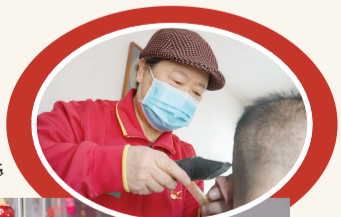
居民讨论生肖设计大赛作品